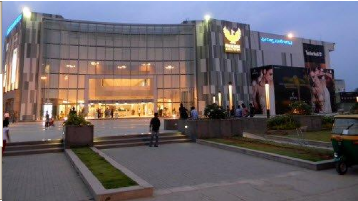
Phoenix Mills, Inde